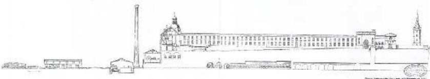
Coupe transversale des caves et des bâtiments en 1852