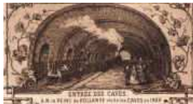
L'entrée des caves