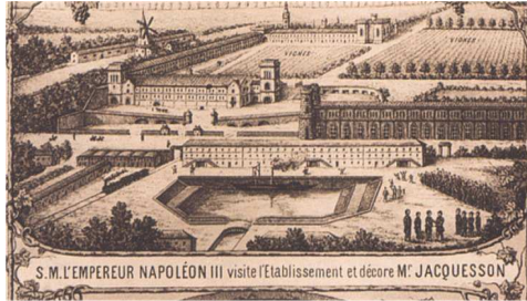
L'ensemble des bâtiments après 1850, avec le canal de l'usine à la Marne