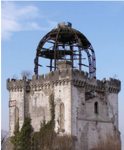
La tour de la distillerie

C'est lui qui assurera la prospérité et ... la perte de l'entreprise. La mort de ses fils (Ernest - 1860 et Eugène - 1865) et des investissements hasardeux plonge la famille dans les dettes. Le bilan est déposé en 1874. Dès 1828, la propriété est agrandie et d'imposants bâtiments sont construits